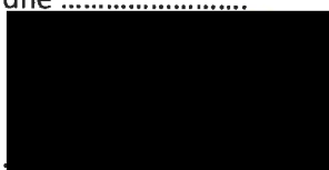
Mgr. Jiří Koubek starosta městské části Praha-Libuš (za poskytovatele dotace)