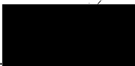
Mgr. Jiří Koubek starosta městské části Praha-Libuš (za poskytovatele dotace)